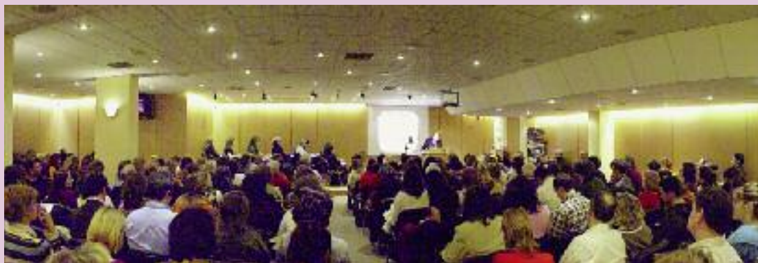
Οι Αίθουσες Λόγου και Τέχνης όπου πραγματοποιούνται τα μαθήματα.