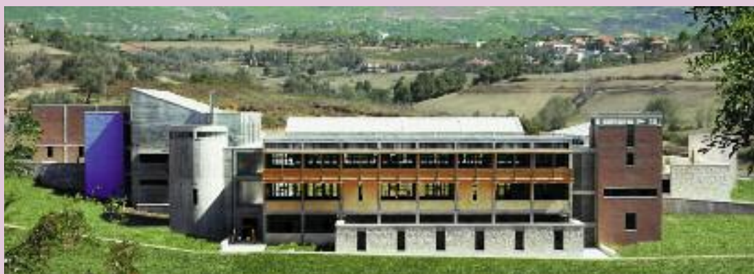
Τα πρωτοποριακά σχολικά συγκροτήματα των Αρσακείων Σχολείων στα Τίρανα τής Αλβανίας και στην Πάτρα, έργα των αρχιτεκτόνων Δημήτρη Ησαΐα και Τάση Παπαϊωάννου